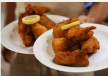
Das Gasthaus Steinbründl ist für die Backhendl weithin bekannt.

Im Gasthaus Steinbründl werden die Gäste bereits seit 1888 bewirtet. Bekannt wurde es durch die Steinbründl-Quelle. Weithin bekannt ist das Gasthaus für seine Backhendl. Ausgehend von Maria Steinbründl gibt es Wanderungen entlang