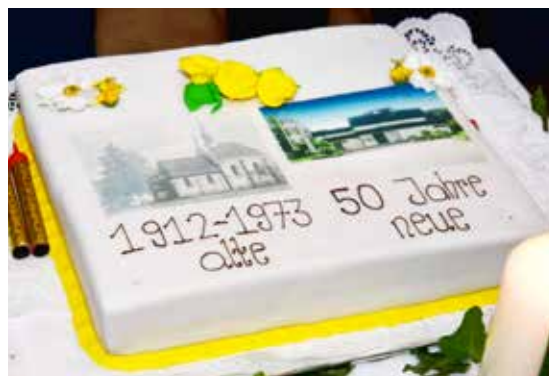
Pfarrgemeinderätin Katharina Schadenhofer spendete die Torte zum Jubiläum.

Errichtet wurde die neue Kirche nach Plänen des St. Pöltner Architekten Paul Pfaffenbichler in Sichtbeton. Durch die geschickte Anlage des Grundrisses kann die Kirche mehrfach genutzt werden.