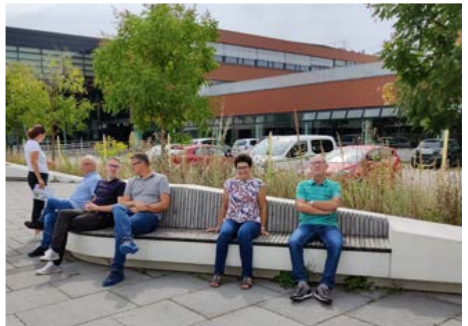
Die Exkursionsteilnehmer*innen bei Ihrer Besichtigung in Wolkersdorf

Um diesen Anspruch, aber auch den Ansprüchen des Landes NÖ und der Umwelt (Versickerungsmöglichkeiten, Verkehrsberuhigung und vieles