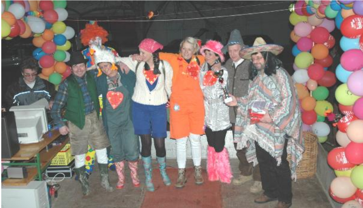
3. Platz „Bauer sucht Frau“