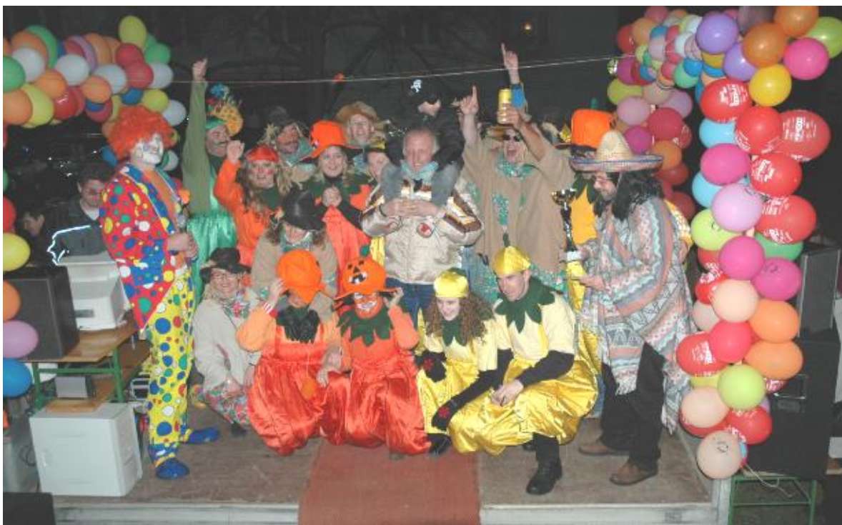
2. Platz „Kürbis-Express“