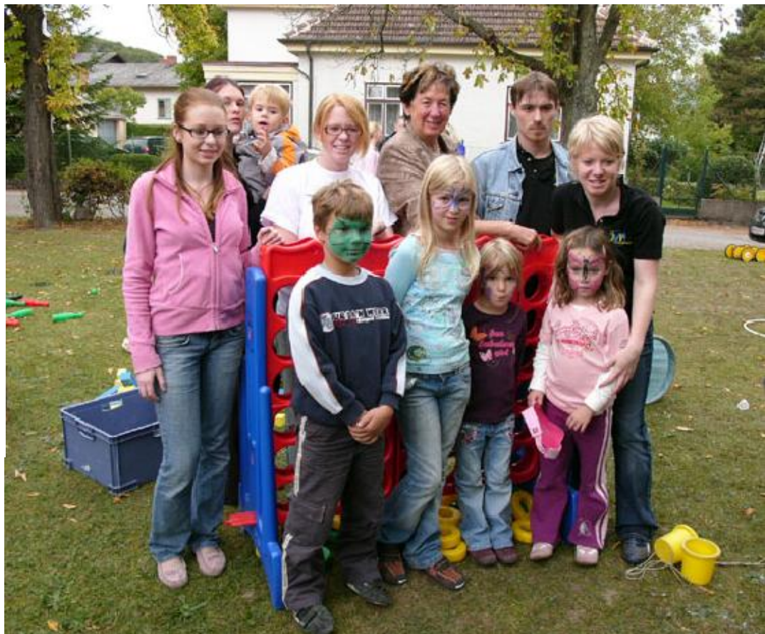
Nusspiade mit der Jungen ÖVP