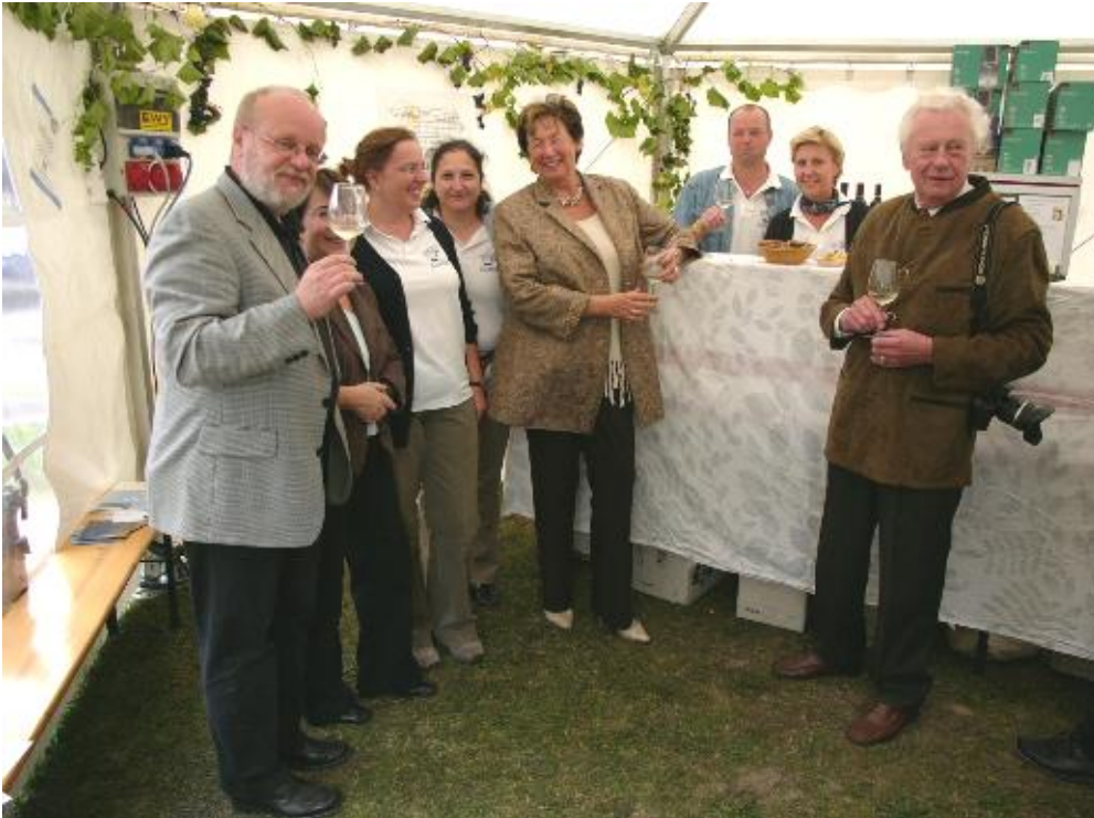
Weinkost des Singvereines