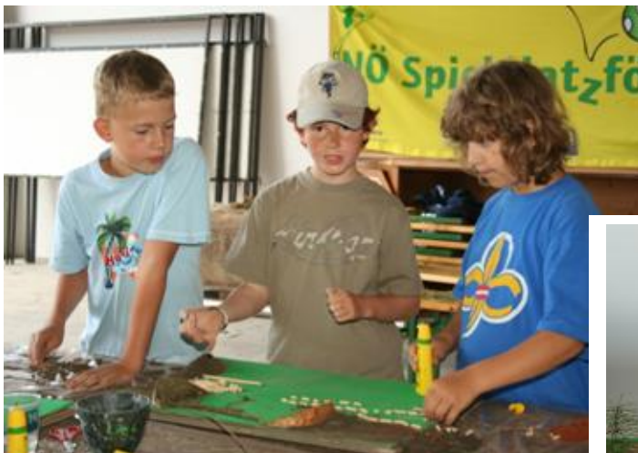
Die eifrigen Spielplatzforscher bei der Arbeit

Einige Eltern haben im Vorfeld schon ein Vorbereitungsseminar am 1.6. in Dürnstein besuchen können, auch ihnen ein Danke für das besondere Engagement.