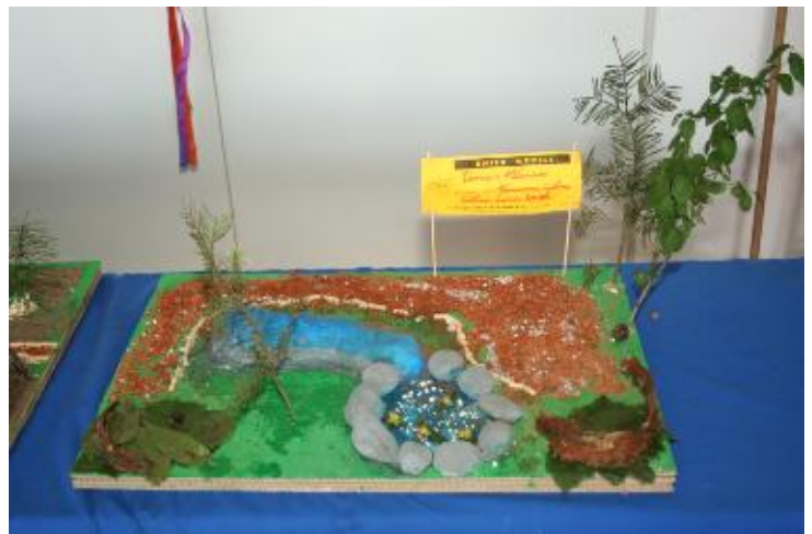
Eines der gefertigten Spielplatzmodelle

Weitere Fotos auf der Homepage: www. Krummnussbaum. at