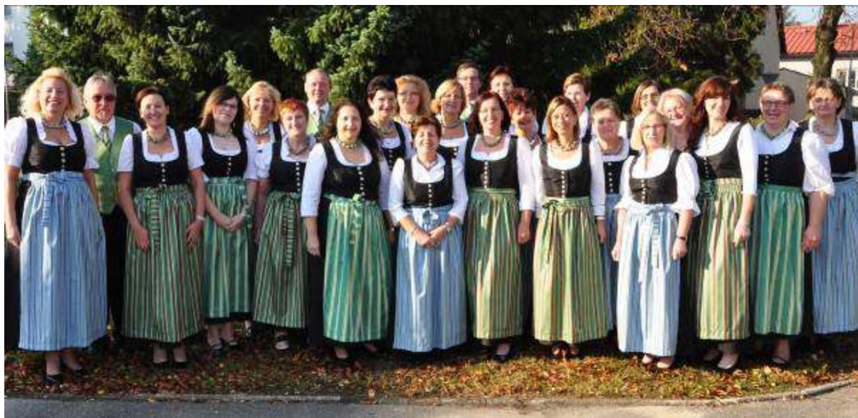
Der Singverein in neuer Tracht

Der Singverein bedankt sich ganz herzlich bei der engagierten Obfrau!