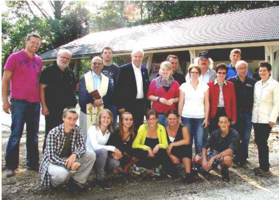
Jugend- und Sportzentrum offiziell eröffnet