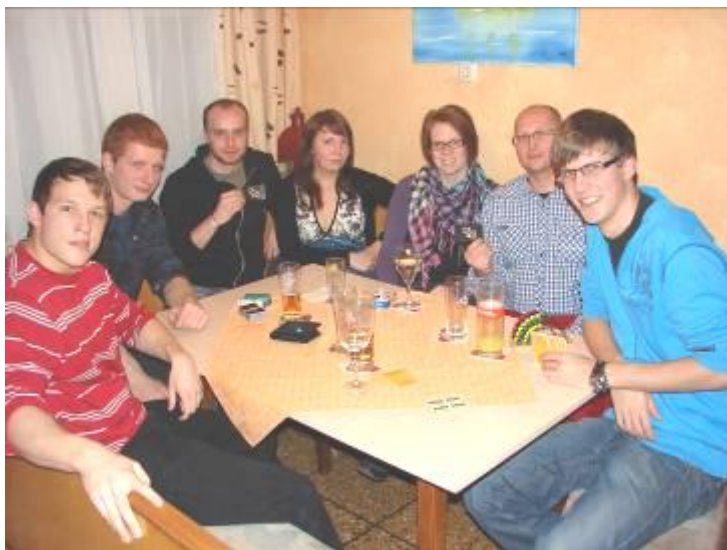
Jugendklub Stammtisch am 14.01.2011 / Gasthof Dultinger "Nusserl"

08.07. GH Dultinger 12.08. Café Galerie 09.09. GH Schiffmeister 14.10. GH Dultinger 11.11. Café Galerie 09.12. GH Schiffmeister