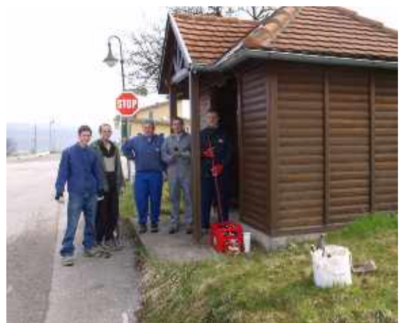
Dorfgemeinschaft Neustift - RCN: Streichen und Reinigen des Buswartehauses in Neustift