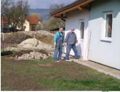
Stockschützen: Sanieren des Traufenpflasters um das Gebäude und Reinigen des Aufenthaltsraumes