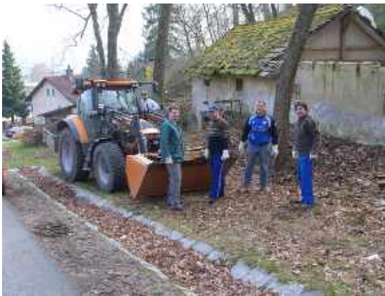
Schießgemeinschaft im Keller am Annastifter Berg: Müllentsorgung bei der Baustelle