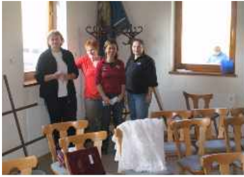
Singverein: Reinigung und Fensterputz