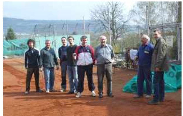
Tennisclub: Estrich am Zubau hergestellt und für die Spielbereitschaft der Plätze gesorgt. Die Räume im Klubhaus gereinigt.