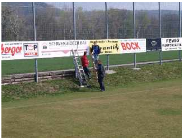
Sportverein: Reinigen und Instandhaltungsarbeiten an der Sportanlage