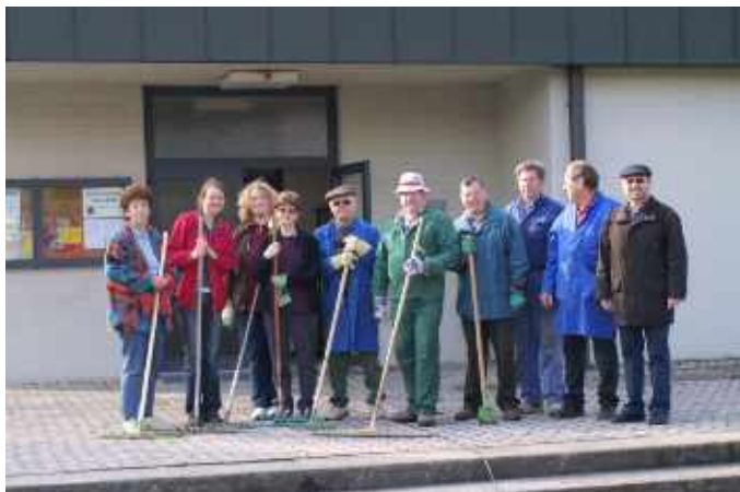
Pfarre: Reinigung des Kirchenplatzes und der Grünanlagen um die Kirche sowie Streichen der Fahnenmaste