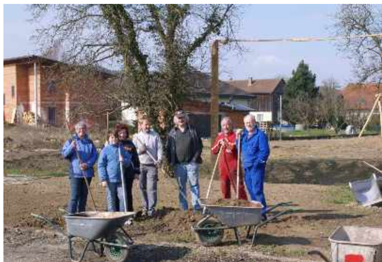
Verein Volkshaus: Reinigung der Liegenschaft (Volkshaus)