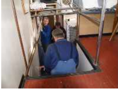
Jachtclub: Reinigen des Geländes und Sanieren des Schiffes im Bootshafen